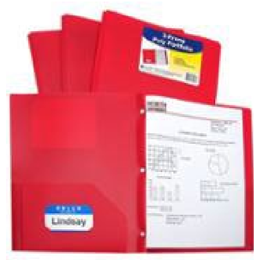
plastic folder with pockets & prongs