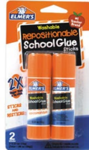
Elmer's glue sticks